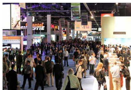
世界から10万人近い業界関係者が訪れる

NAB Showは、米国のみならず、世界市場を対象にした最新の放送・映像・音響機器が集まる展示会として、日本からも毎年多くの業界関係者が参加します。4月のNAB Showで発表・参考出展された製品はその後、9月に開催される欧州最大の放送機器展「IBC」(オランダ)を経て、本年は11月19日(水)から21日(金)まで、幕張メッセで開催される「Inter BEE 2014」で具体的な製品として市場投入されます。