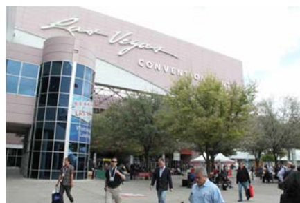
NAB Showの会場となったラスベガス・コンベンションセンター

4月7日から10日に米・ラスベガスで開催されたNAB Showの主催団体、NAB(National Association of Broadcasters)の公認イベントとして、NAB Showで出展した最新情報を一堂に集め、日本国内のユーザにご紹介いただく機会といたします。主催は、NAB日本代表事務所(映像新聞社)、一般社団法人日本エレクトロニクスショー協会。