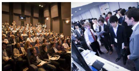
昨年の第1回After NAB Show Tokyo 2013会場風景

今回の After NAB Show では、そうした最新の傾向を象徴する製品が各社から紹介されるほか、日本市場へのリリースの時期や価格など、NAB Show では明かされなかった日本開催ならではの情報も提供される予定です。さらに、放送・映像機器に詳しいジャーナリストらによる NAB Show 報告なども実施し、NAB Show の最新動向を把握していただくことができます。